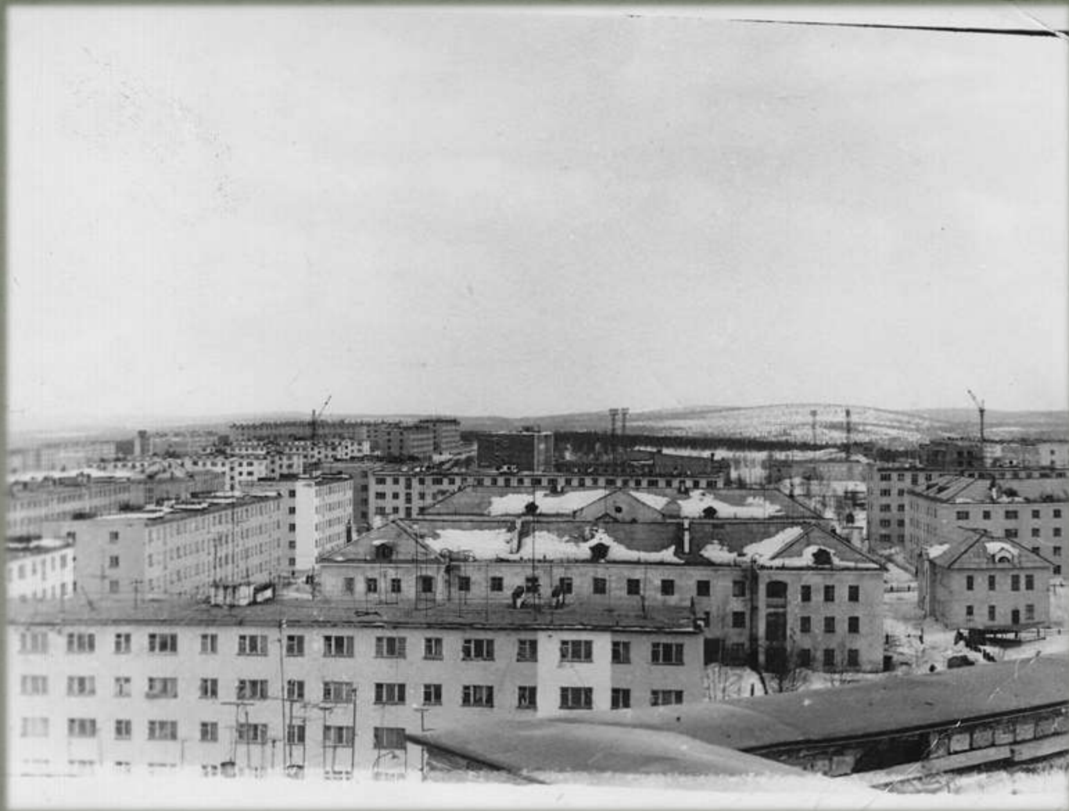
Вид на улицы Космонавтов и Ленина, 1970 г.