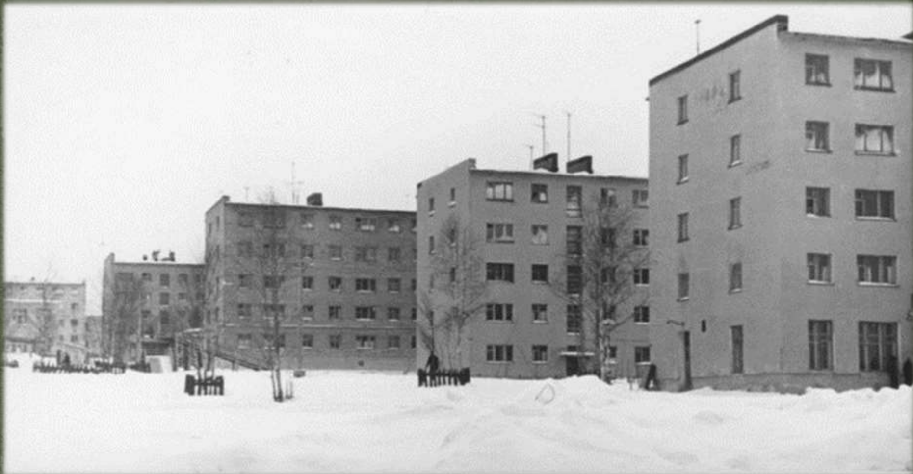
г. Апатиты, ул. Космонавтов