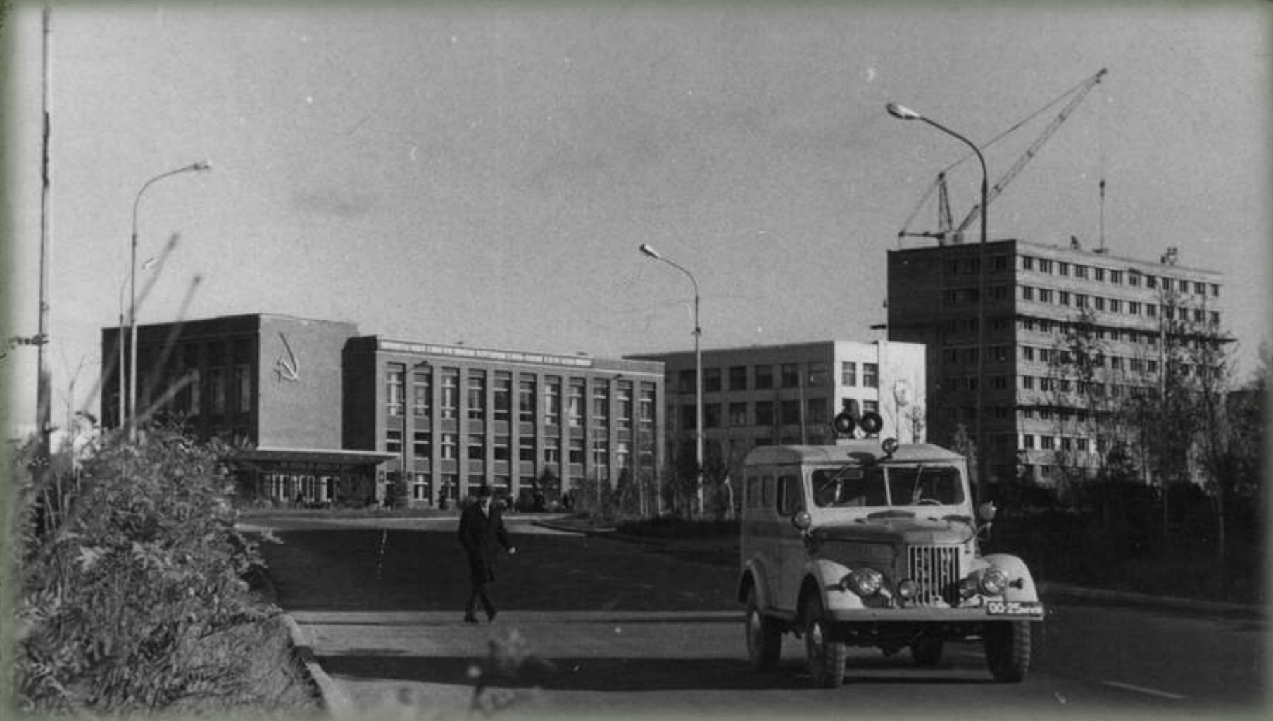
Центральная площадь г. Апатиты, июнь 1974 г.