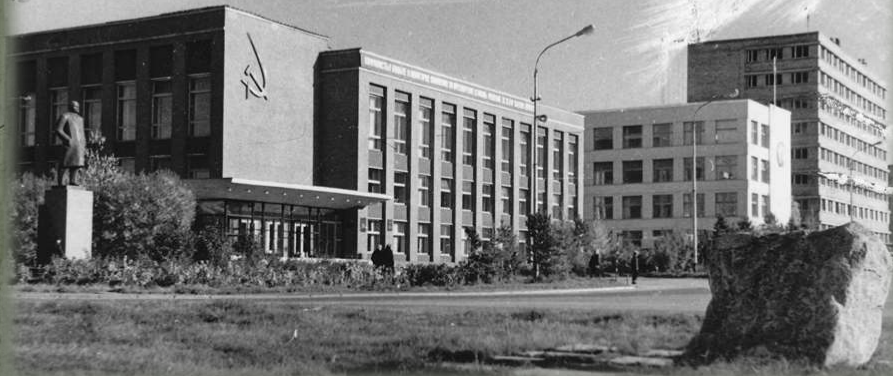
Центральная площадь г. Апатиты