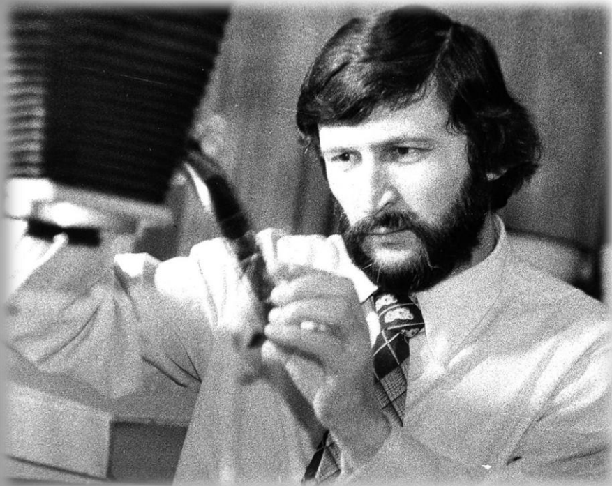
Ю.М. Колей, фотограф объединения Мурманоблфото. г. Апатиты. 1983 г. ГОКУ ГАМО в г. Кировске. Ф. Р-520. Оп. 1. Д. 3813.