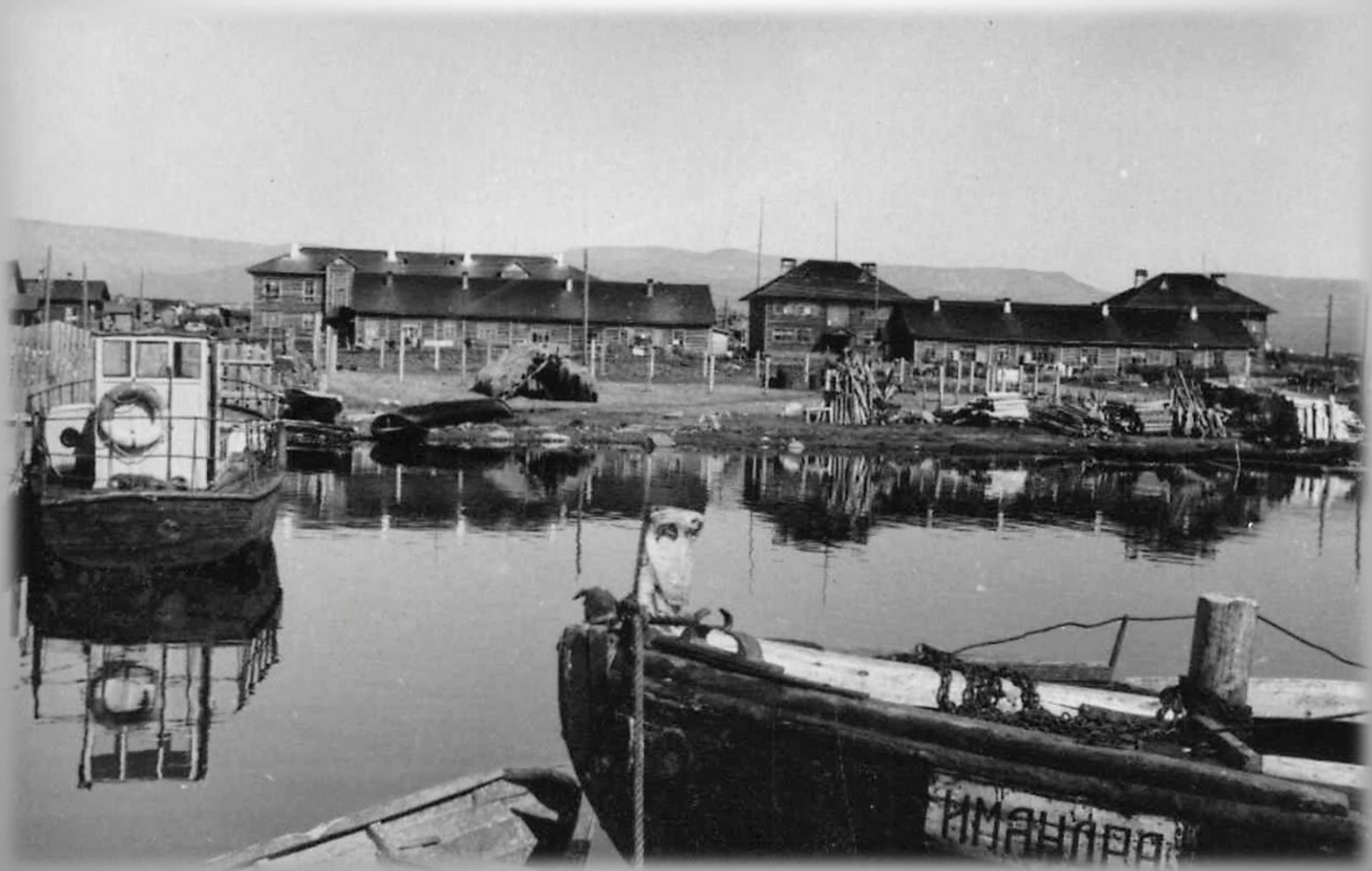
Бухта Тик-Губа. Пристань и поселок Мурманского треста местных водоемов. 1946 г. ГОКУ ГАМО в г. Кировске. Ф. Р-179. Оп. 12. Д. 834.