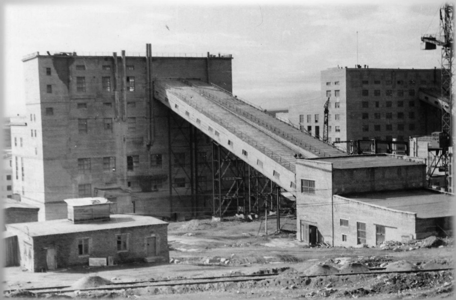
Корпус среднего дробления АНОФ-2. г. Апатиты. 1963 г. ГОКУ ГАМО в г. Кировске. Ф. Р-520. Оп. 1. Д. 527.