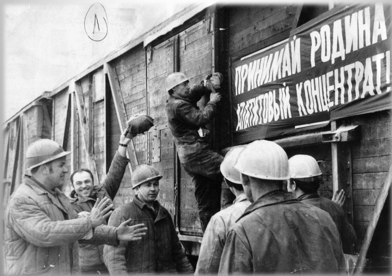
Рабочие цеха погрузки АНОФ-2. г. Апатиты. 1972 г.