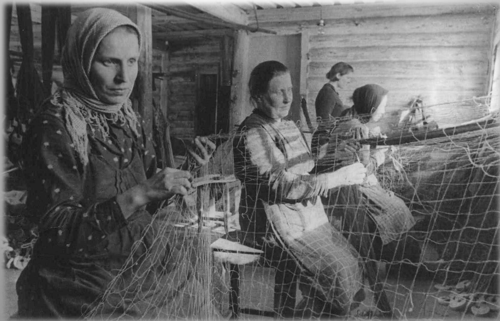
В ремонтной мастерской рыбпромхоза за починкой сетей ГОКУ ГАМО в г. Кировске. Ф. Р-179. Оп. 12. Д. 843.