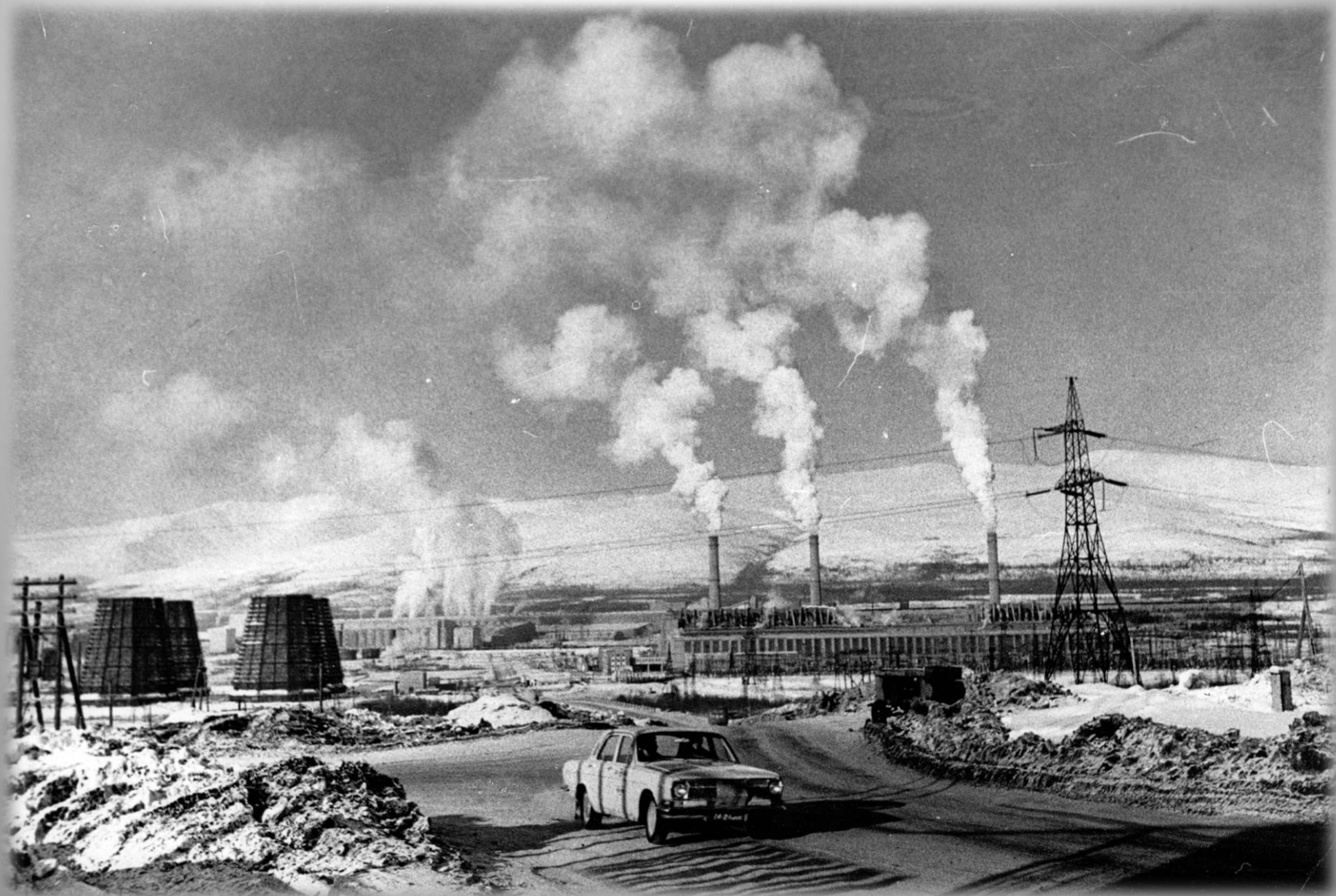
Индустриальный пейзаж. г. Апатиты. 1979 г.