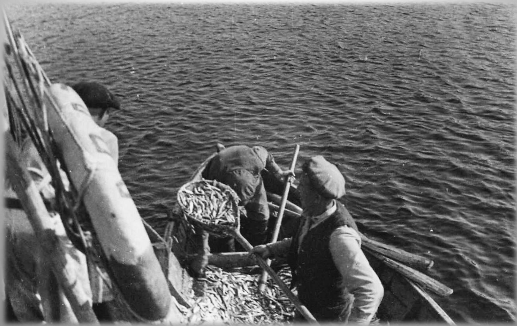
Сдача улова ряпушки на бот. 1946 г. ГОКУ ГАМО в г. Кировске. Ф. Р-179. Оп. 12. Д. 836.