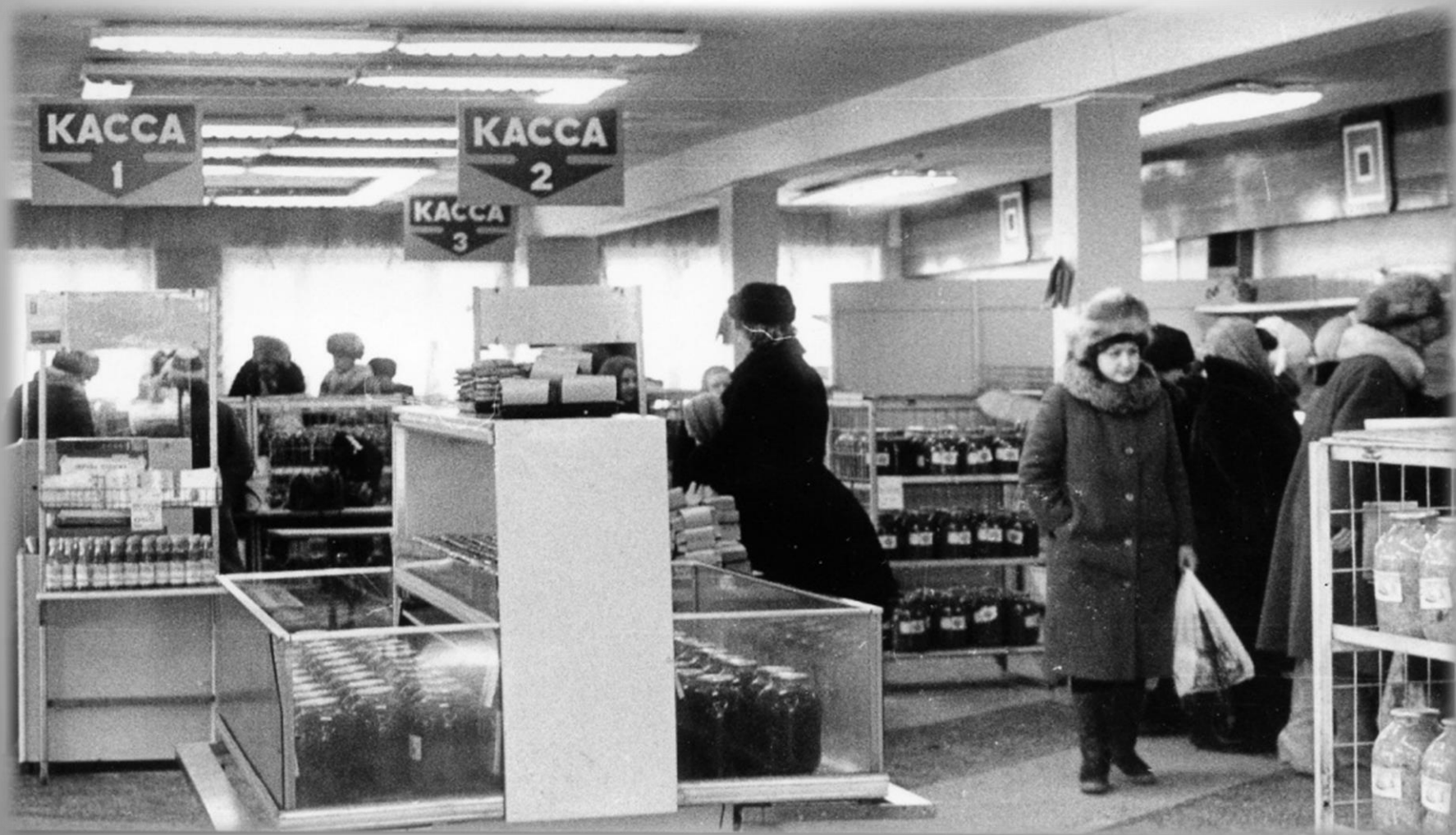
Универсам в микрорайоне старых Апатитов. В одном из отделов магазина. 1989 г. ГОКУ ГАМО в г. Кировске. Ф. Р-19. Оп. 4. Д. 476.