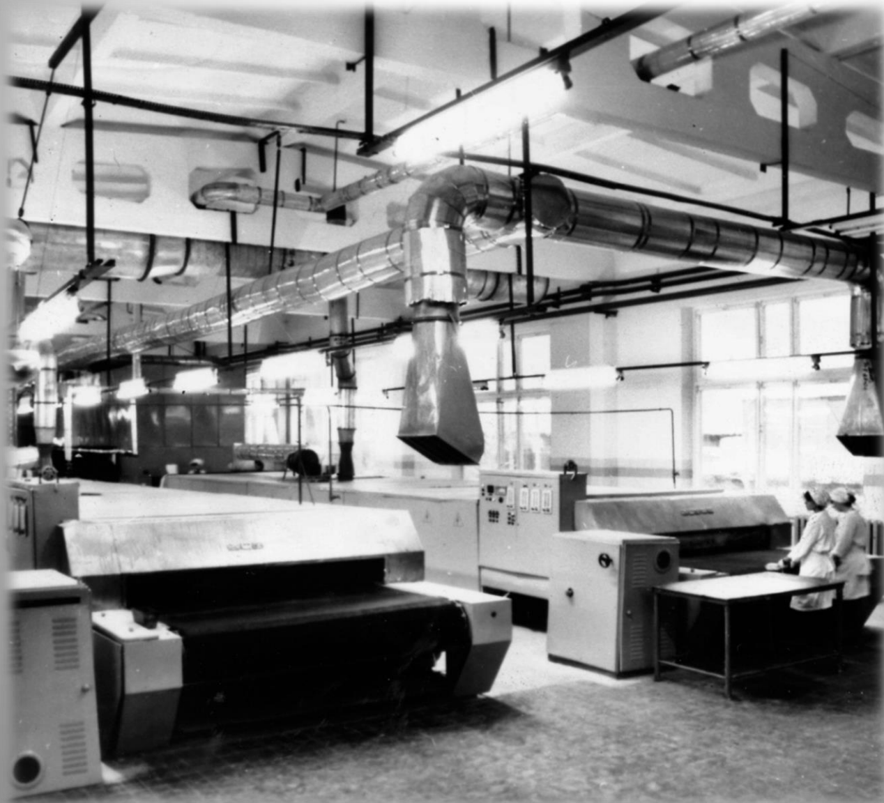
Поточная линия для выпечки хлебобулочных изделий в новом цехе Апатитского хлебопекарного объединения. г. Апатиты. 1987 г. ГОКУ ГАМО в г. Кировске. Ф. Р-19. Оп. 4. Д. 399.