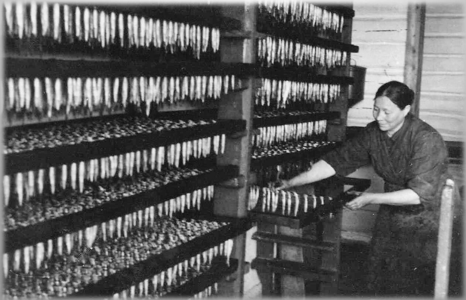
Подготовка ряпушки к копчению. 1946 г. ГОКУ ГАМО в г. Кировске. Ф. Р-179. Оп. 12. Д. 837.