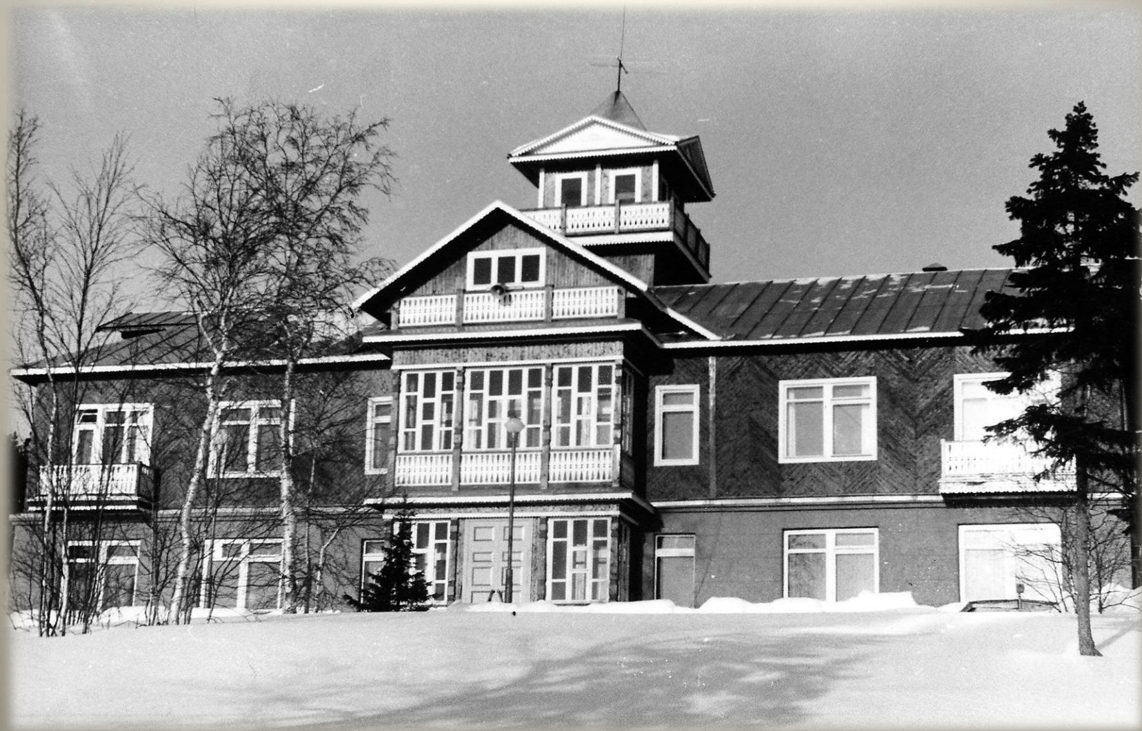
Санаторий - профилакторий Кольского филиала АН СССР. 1982 г. ГОКУ ГАМО в г. Кировске. Ф. Р-520. Оп. 1. Д. 3388.