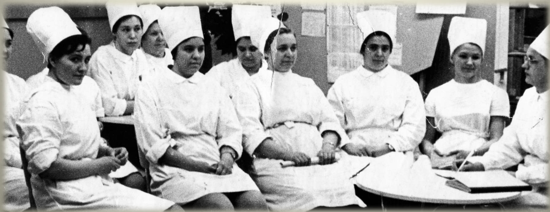
Апатитская больница. Совет медсестер. 1970 г.