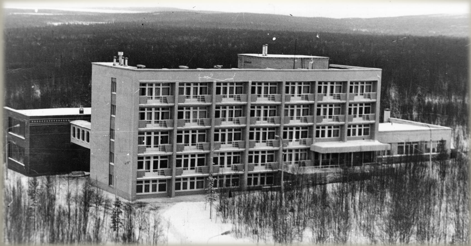
Санаторий-профилакторий треста «Апатитстрой». г. Апатиты. 1978 г. ГОКУ ГАМО в г. Кировске. Ф. Р-520. Оп. 1. Д. 2561.