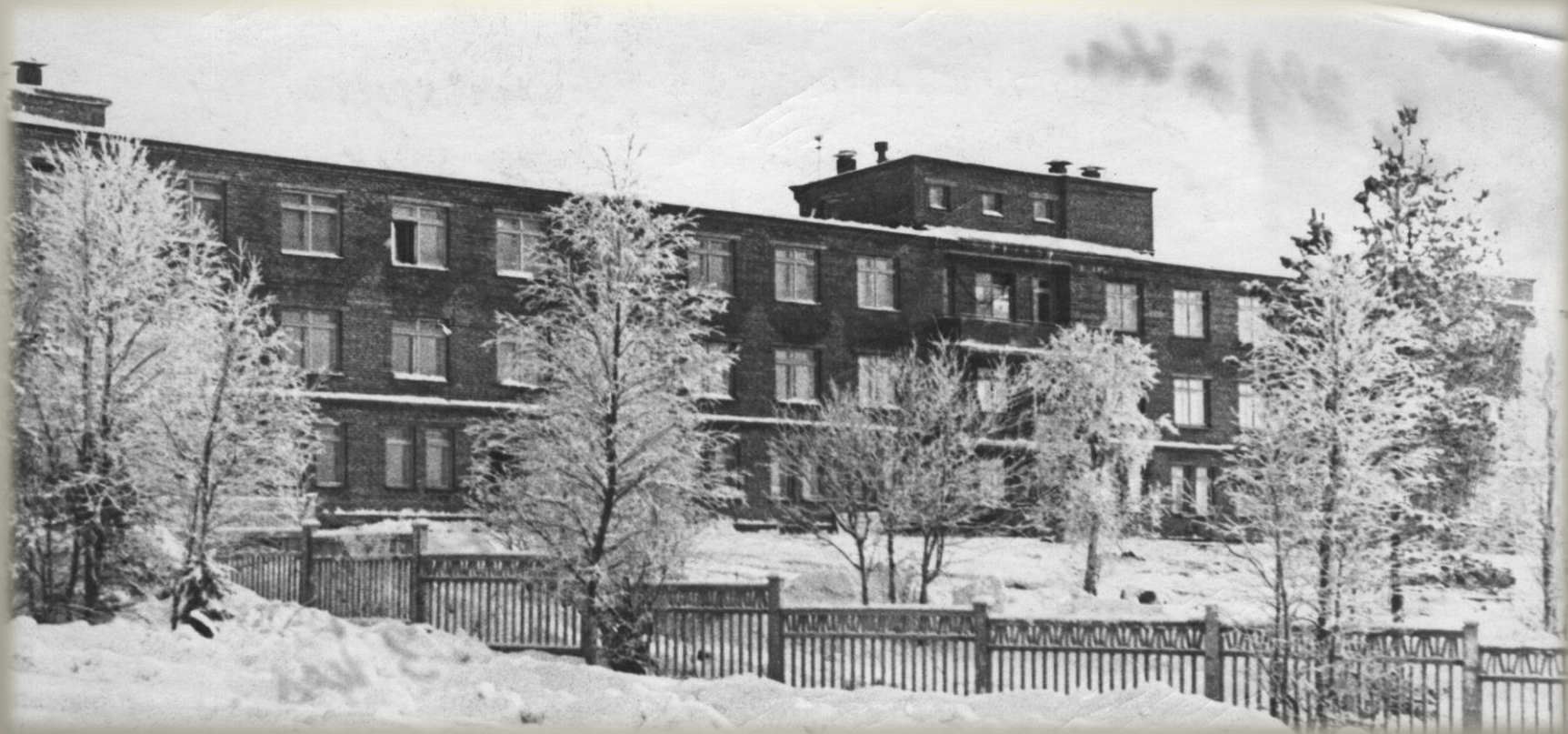
Больница в Новом Городе. 1966 г. ГОКУ ГАМО в г. Кировске. Ф. Р-19. Оп. 3. Д. 211.